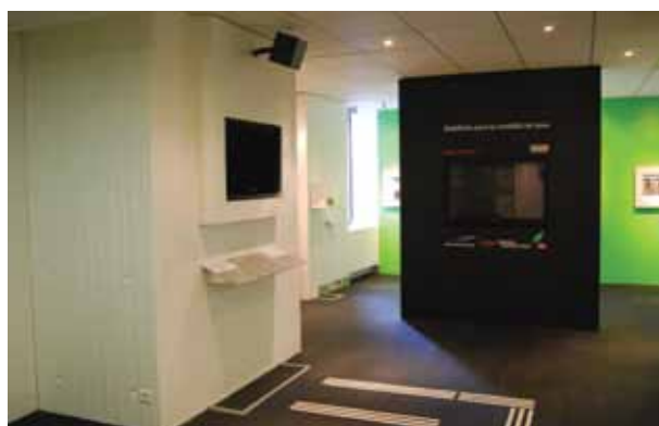
Showroom SNCF - Paris

utilisées par groupe de 4 ou 5 balises, elles permettent de choisir entre plusieurs directions. Le groupe de balises est orchestré de façon à ce que les messages soient émis les uns après les autres afin que l'information soit claire. Cette fonction a été créée en partenariat avec la SNCF, et est protégée par un brevet déposé en son nom.