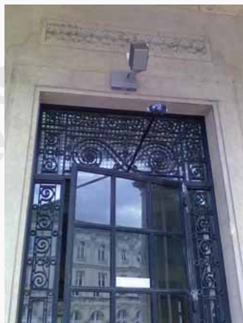
Gare de Vittel

www.activeaudio.fr - info@activeaudio.fr