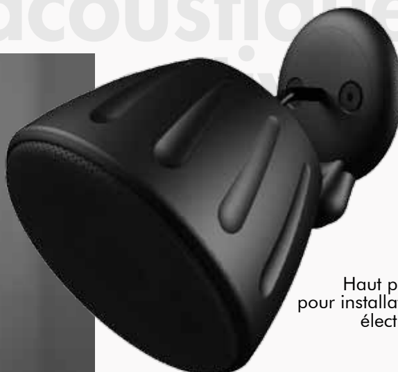
Haut parleur 8 Ω 20W, pour installation en intérieur, électronique séparée