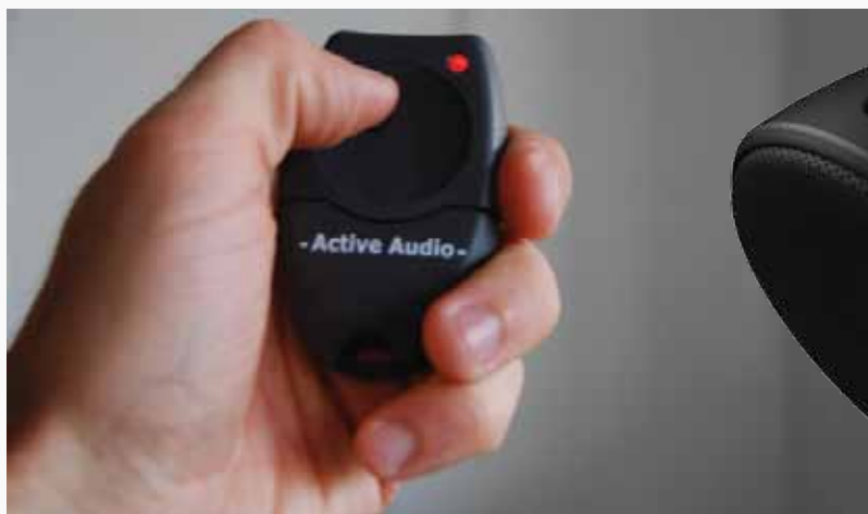
Télécommande conforme NF S 32-002